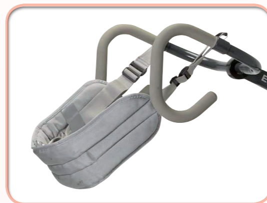
Sangle Polypropylène, lavable à 30°