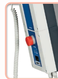
Bouton arrêt d'urgence